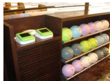
with AL モバイル端末とボール